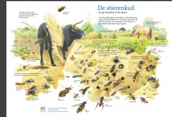
De stierenkuil en zijn sleutelrol in de natuur Ark