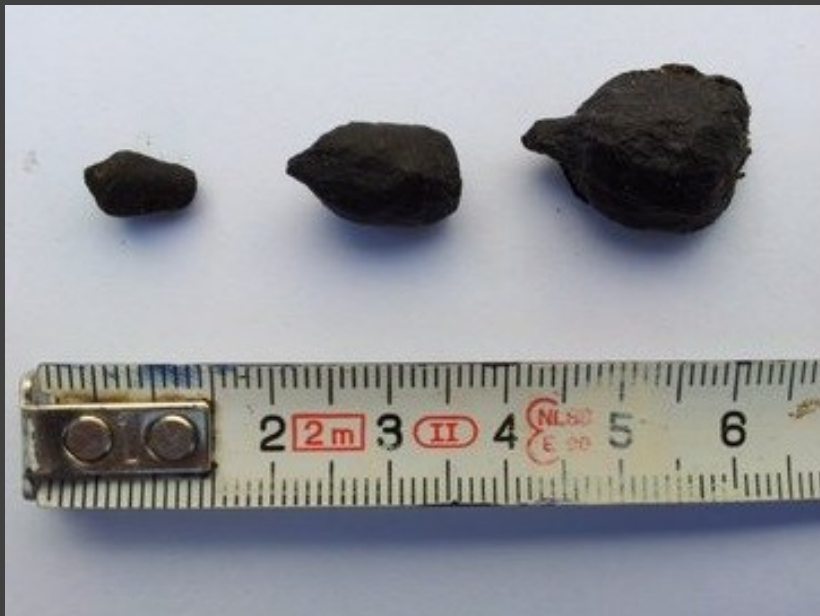
Afmetingen van keutels. Van links naar rechts ree, damhert, edelhert